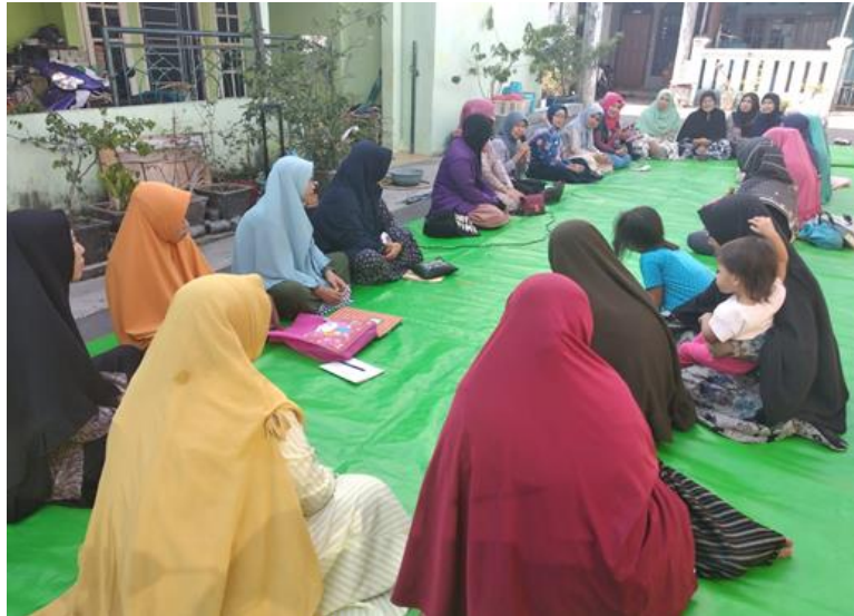
Gambar 2. Sesi Diskusi dan Evaluasi Kegiatan