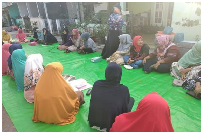
Gambar 1. Sesi Penyampaian Materi Manajemen Keuangan Digital

Respon ini menunjukkan bahwa program tidak hanya meningkatkan pengetahuan, tetapi juga mengubah sikap dan kesiapan adopsi teknologi.