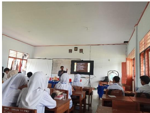
Gambar 3. Penyampaian materi kepemimpinan melalui metode ceramah interaktif oleh fasilitator sebagai pengantar konsep dasar kepemimpinan.