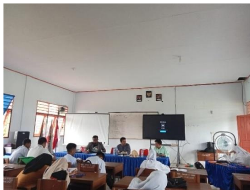
Gambar 5. Pelaksanaan simulasi kepemimpinan yang melibatkan peserta dalam peran tertentu untuk melatih pengambilan keputusan dan kerja sama tim.