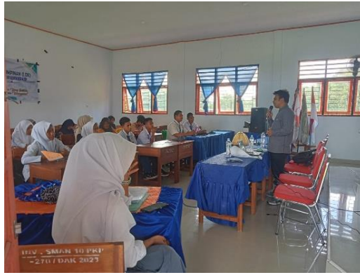
Gambar 2. Suasana pembukaan kegiatan Pelatihan Dasar Kepemimpinan (LDK) di Aula SMA Negeri 10 Kabupaten Pangkep yang diikuti oleh peserta didik dengan pendampingan fasilitator.