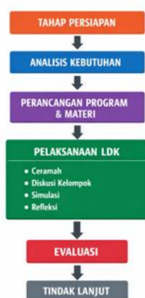
Gambar 1. Bagan flowchart