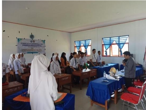
Gambar 4. Kegiatan diskusi kelompok peserta dalam menganalisis studi kasus organisasi sebagai bagian dari pembelajaran kolaboratif.